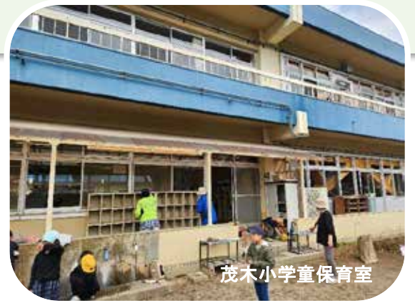
茂木小学童保育室

各小学校の空き教室を借用して、茂木小学童は 3 教室、逆川小学童と中川小学童を合わせると計 5 教室の受託事業となります。総勢 16 名の指導員が、交代で児童 144 名の放課後の居場所と安全を確保しています。