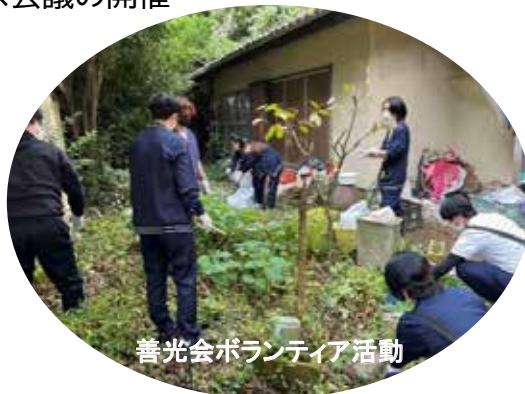
善光会ボランティア活動