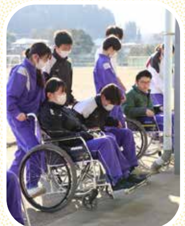
車イスの貸し出しは社協会費によって賄われています