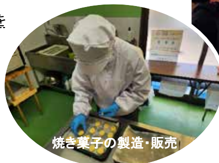
焼き菓子の製造・販売