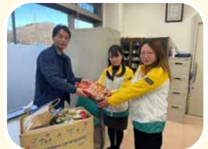
明治安田生命真岡支社 様より 食料品等の寄附 (3/4)

皆さまからいただいた物品は、フードバンク事業等での食糧支援や町内福祉施設等へ配付させていただきます。