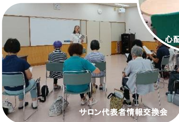
サロン代表者情報交換会