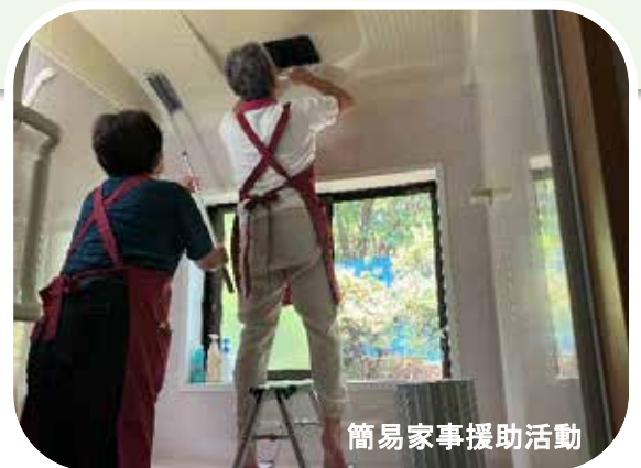
簡易家事援助活動