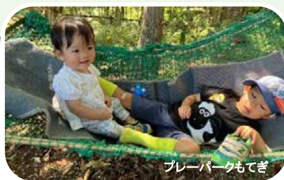
プレーパークもてぎ