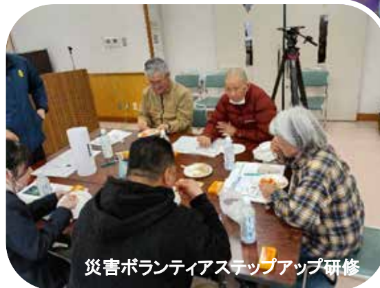
災害ボランティアステップアップ研修