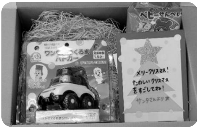
実際に子どもたちに贈られたプレゼントのひとつ！

プレゼントを受け取った子どもたちから、自分宛のクリスマスプレゼントを抱きしめ、とても嬉しそうなお笑いの写真と、お礼のメッセージがたくさん届きました。