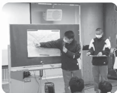
避難経路調査の発表の様子

中学生の福祉出前講座の一環として茂木の町内にある避難所までの道のりを車イス利用者や、目・耳が不自由な人の立場になって実際に歩き、どのような困難があるのか調査しました。