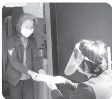
昨年度の災害時見守り訓練の様子