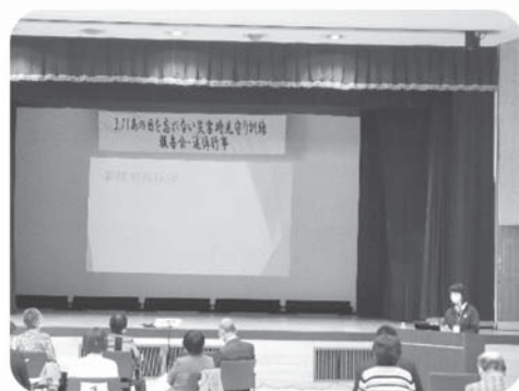
追悼行事にて災害時の体制の必要性を説明する様子

社協の災害ボランティアセンターが主体となり、地域住民と一緒に実施している訓練です。災害時の見守り訓練「安否確認」を実施し、災害時に即座に一人ひとりが役割を持つて対応できるよう、備える訓練です。