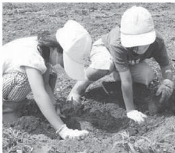
令和4年度のジャガイモの収穫の様子

茂木町に住む子どもたちが、豊かな自然の中での活動をとおして、自然の中の心地良さや外で活動することの喜びを感じたり、時間の経過とともに育っていく様子をみながら、育てる喜びや生きていることを実感するという目的のもと、社会福祉協議会では、農作業の体験を実施しています。毎年多くの子どもたちが参加し、普段ふれあう機会の少ない大人たちとともに、種まきから収穫、命に感謝しながらいただくという体験を、年間を通して実施しています。また、自然の中で思い切り走ったり、季節の草花を観察したりと、茂木町の自然を体感し、子どもたちの心にいつまでも残るような体験を実施していきたいと思えます。 3月は15名の子どもたちとジャガイモの種まきをして、収穫までの体験活動を実施します。