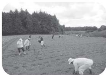
右上：館内販売の様子 右下：もっくろっくの箱詰めの様子 左上：エゴマの定植の様子