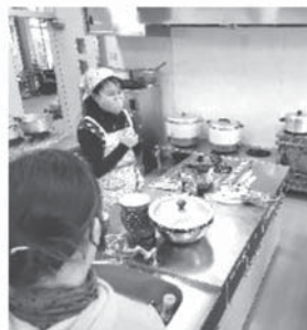
交流会でグルテンフリーの調理や説明をしている様子

前回の講演会で紹介された腸内環境を整える方法の一つ「グルテンフリー」。それをより身近に感じてほしいと、米粉で作られた麺「フォー」を使って家庭でも簡単にできる、鶏肉のフォーの調理の方法の説明と試食を行いました。