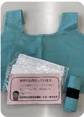
▲昨年度までに配付した衛生用品