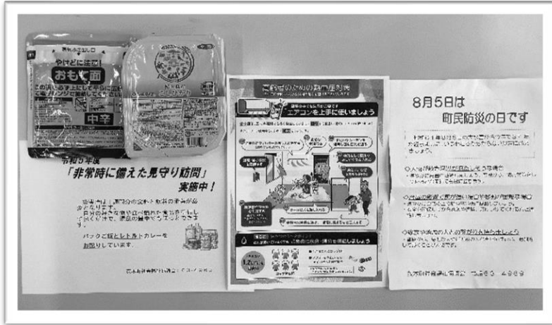
▲防災や熱中症喚起のチラシと非常食のカレーとご飯を配付しました

訓練には、茂木町ボランティア連絡協議会加盟団体を始めとする119名のボランティアにご参加いただき世帯の安否確認をしました。