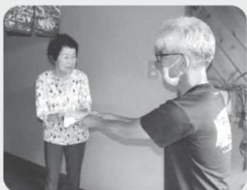
▲今年度実施した災害時見守り訓練の様子