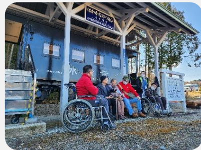
◀ 鍛錬会で町内観光した際の様子