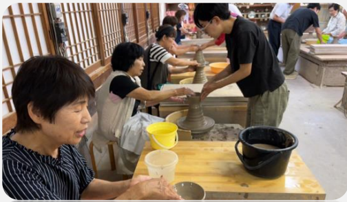
◀ 女性のつどいにて陶芸体験