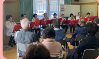
【オカリナコンサート】