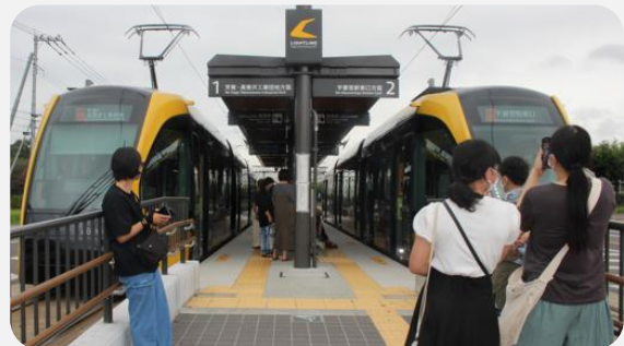
◀ かしの森公園前から乗車しました